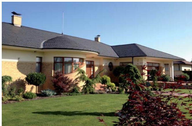
Typ obkladu - FB GD.

„ČI MÁTE MODERNÝ, RUSTIKÁLNY ALEBO JUŽANSKÝ ŠTÝL DOMU, VŠADE SA DAJÚ POUŽIŤ LÍCOVÉ TEHLY, KTORÉ SÚ UNIVERZÁLNE, A PRETO SÚ VHODNÉ NA DOPLNENIE KTORÉHOKOLVEK ŠTÝLU.“