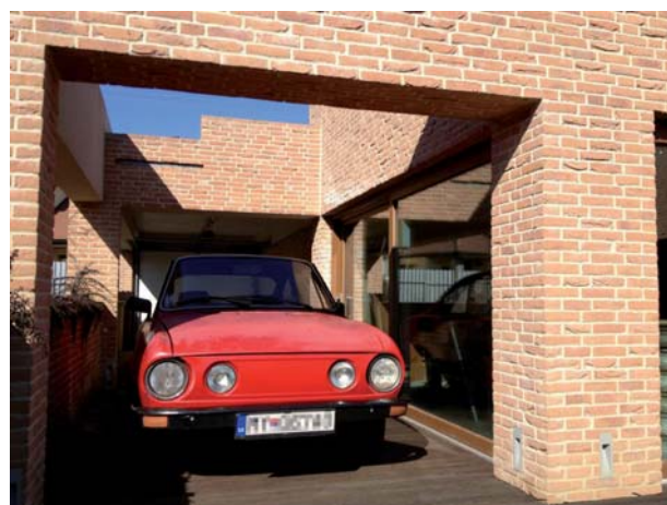
Typ obkladu - ROSE BLOND.