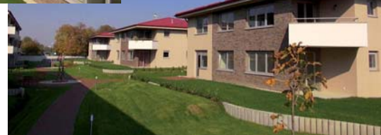
Typ obkladu MIX - Melrose Rusovce.

nuteľné tehlové obloženie z radu Rustique. Sme radi, že aj vďaka nám si môžu hostia vychutnať skvelé posedenie v nezabudnuteľnej atmosfére.