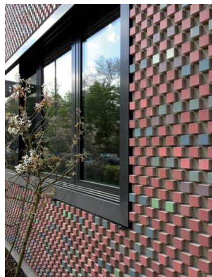
Typ obkladu - 3D glazované tehličky munchen.

Lícové obkladové pásiky Rustique 3D® dokážu vďaka trojrozmernému efektu na každej stene či inom povrchu vyčarovať skutočne podmanivé dielo. Obzvlášť si ho vychutnáte pri nasvietení zhora, zdola alebo z bočných strán, pretože vystupujúce časti obkladu pod dopadom svetla vrhajú tieň, umocňujúce trojrozmerný dojem a krásu tehli-