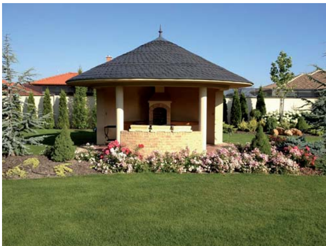
Typ obkladu - TERRA COTTA.