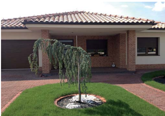
Typ obkladu - TERRA COTTA.

Ide o vysokokvalitné, ručne alebo strojovo formované a vyrábané tehly. RUSTIQUE, a.s., sa špecializuje na exkluzívne lícové tehly, obkladové pásiky rustikálneho aj moderného štýlu, klinkery a na pálené tehlové dlažby. Ich uplatnenie zaručuje podstatne dlhšiu trvanlivosť všetkých materiálov použitých pri stavbe, čím sa predlži jej životnosť, pričom úplne zaniká údržba fasády. Budovy z lícových tehál sú trvácne, pretože sú odolné proti mrazu, dobre znášajú teplotné zmeny a ne strácajú farebnosť.