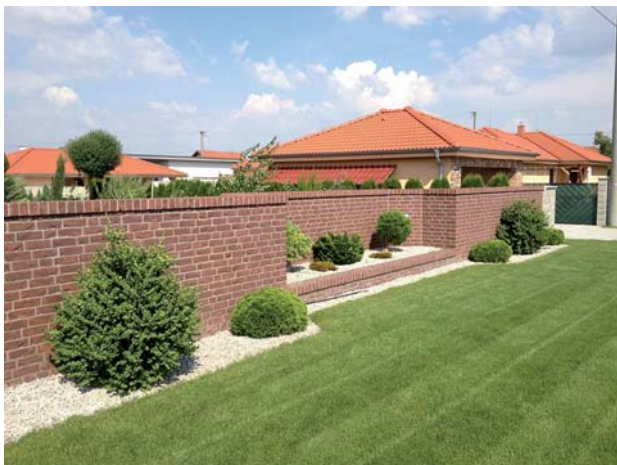
Typ obkladu - OUD MAAS.

„ČI MÁTE MODERNÝ, RUSTIKÁLNY ALEBO JUŽANSKÝ ŠTÝL DOMU, VŠADE SA DAJÚ POUŽIŤ LÍCOVÉ TEHLY, KTORÉ SÚ UNIVERZÁLNE, A PRETO SÚ VHODNÉ NA DOPLNENIE KTORÉHOKOLVEK ŠTÝLU.“