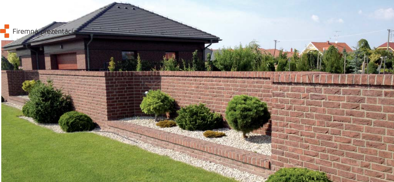
Typ obkladu OUD MAAS - plot v kombinácii s fasádou domu.