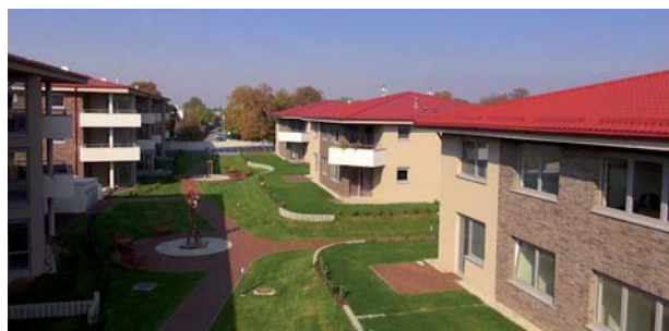
Typ obkladu MIX - Melrose Rusovce.