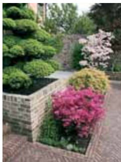
Typ obkladu – Bronseo Antiek. Typ dlažby – Baltrum (210 x 52 x 65 mm).