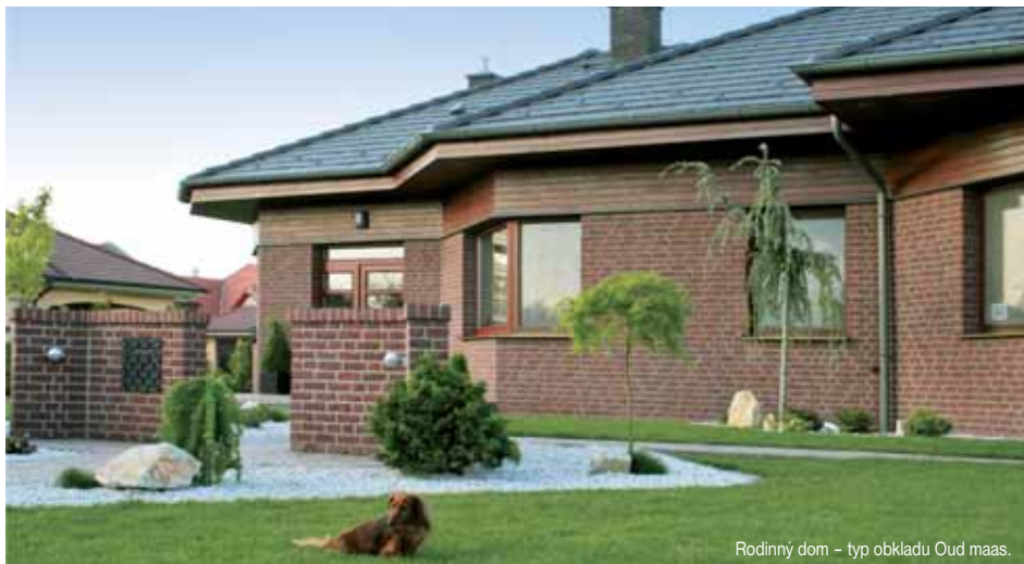
Rodinný dom – typ obkladu Oud maas.

obkladov ich zmyje prvý dážď. Aj vy hľadáte nadčasové riešenia? Rustique vám pomôže vybrať to pravé.