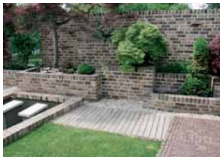
Typ obkladu – Bronseo Antiek.