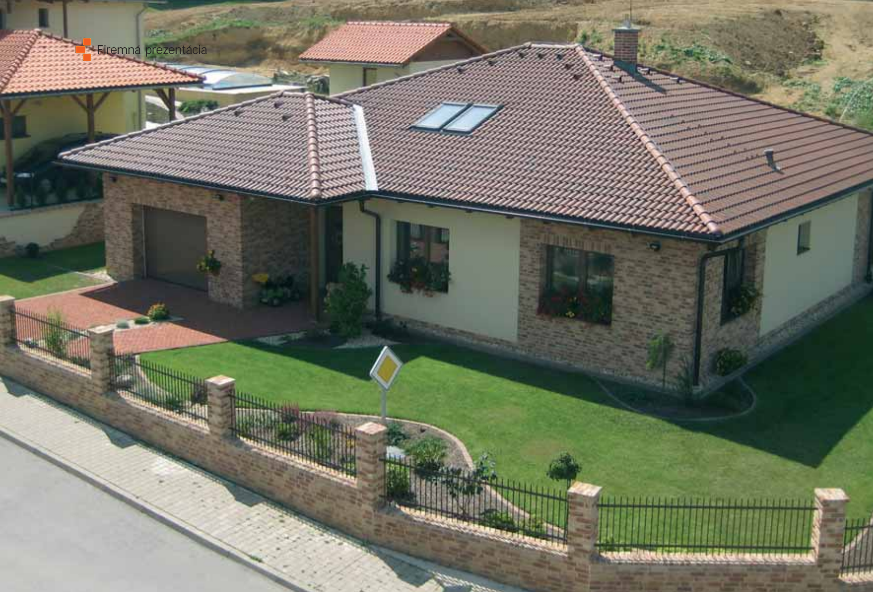
Obklad Terra Cotta.