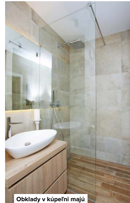
Obklady v kúpeľni majú dekor kameňa a dreva.